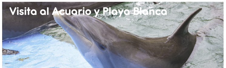
Visita al Acuario y Playa Blanca