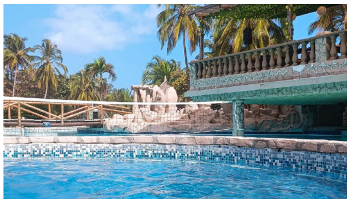
Piscina al aire libre