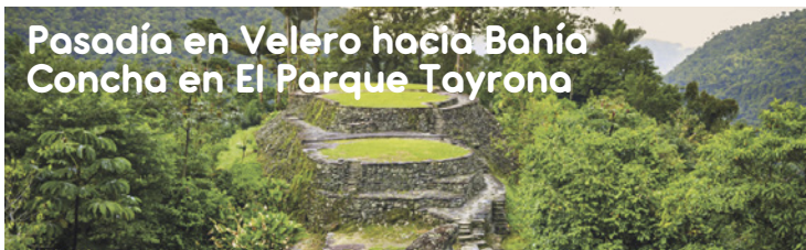
Pasadía en Velero hacia Bahía Concha en El Parque Tayrona

Acuario y museo del mar, National Park Tayrona, Buceo, Kayak, Snorkeling, Tourist Information Magdalena, Taganga