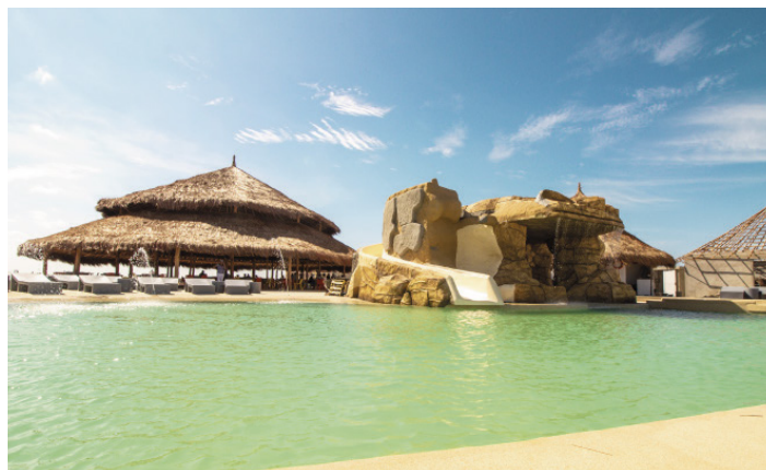
Piscina oasis para adultos.